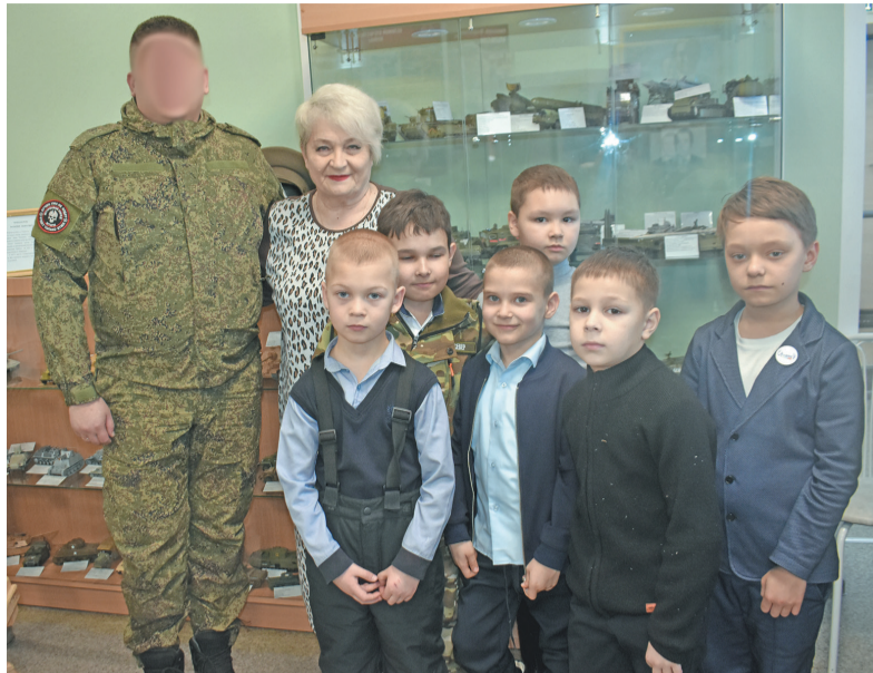
20 февраля в Историко-краеведческом музее им. Н.К. Киселевой состоялась презентация вы-

ставочной экспозиции «Стальные свидетели войны». Мероприятие прошло в рамках федерального